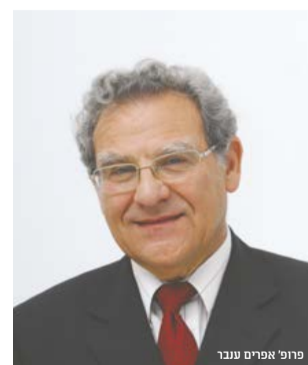
פרופ' אפרים ענבר

"הרעיון הפאן ערבי מוכרס במבנה המדינות כי הוא טוען שהעולם הערבי צריך להיות מורכב מיחידה פוליטית אחת."