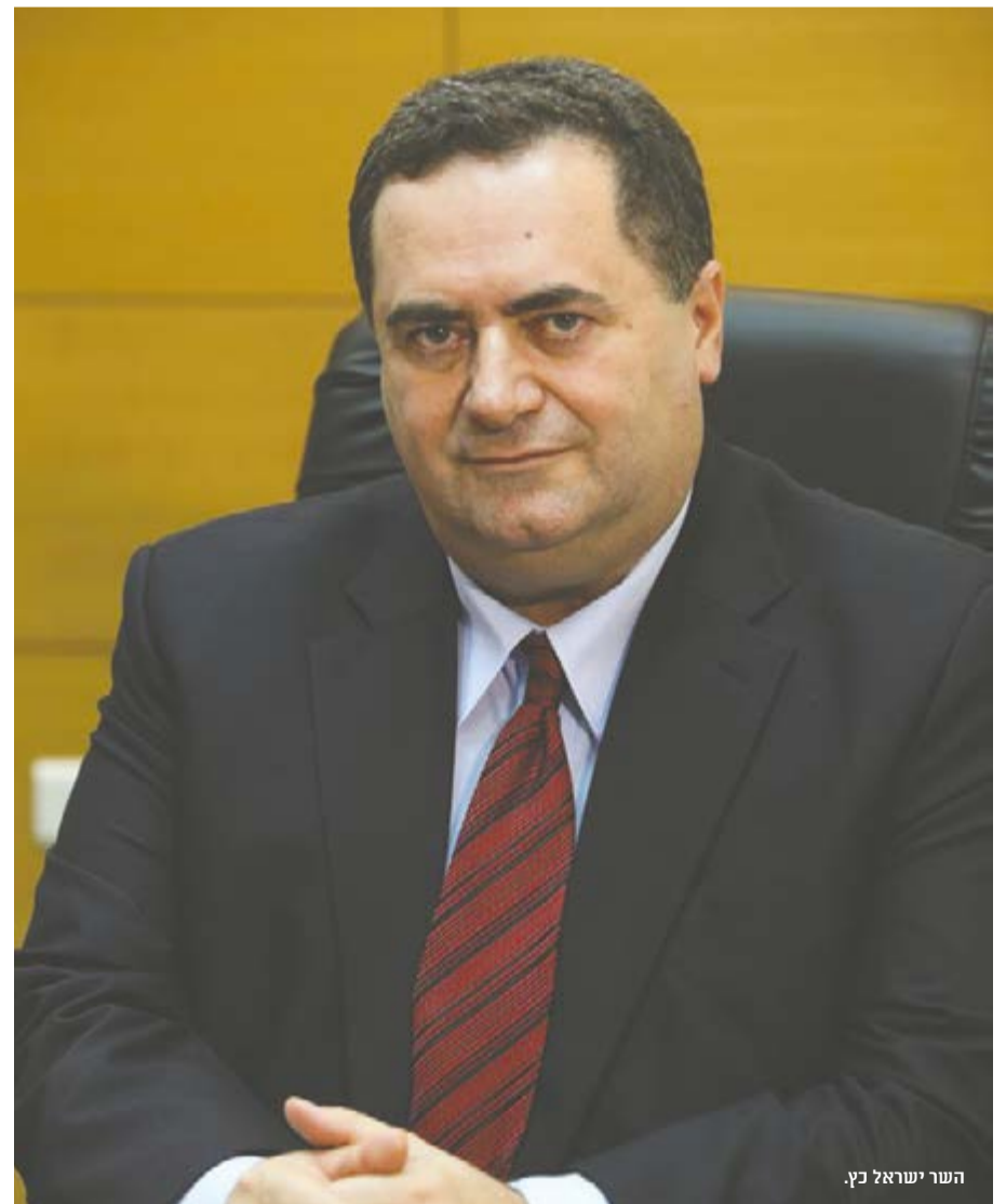
השר ישראל כץ

ומה באשר לאוכלוסייה הערבית על פי התכנית של כץ מחוץ אותנו לפתרון שעליו דובר כבר בקמפ-דייב, רעיון האוטונומיה. "בחזונו אני רואה אוטונומיה לתושבים הערבים כמו שנקבע בקמפ-דייב. זה היה הכי נכון וחבל שהדיון בזה הפוסק. כל הניסיון ללכת לכיוון של מדינה פלשתינית מלכתחילה נועד לכישלון. אני מדבר על אוטונומיה עם זיקה אזרחית לירדן וסוג של זיקה פוליטית בעתיד לירדן, אוטונומיה שתאפשר להם לנהל את חייהם אבל ללא ענייני חוץ וביטחון".