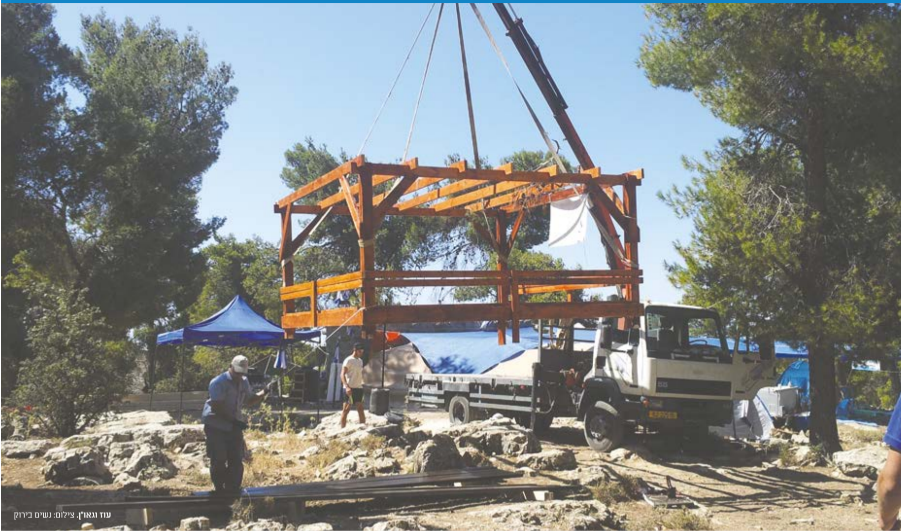
עוז וגאון.

את המקום, מנכשים, מנקים ומכשירים אותו כאתר מכובד וראוי בו יונצח זכרם של נכדו וחבריו החטופים שנרצחו. הסב הביע תקווה להתרחבותו של המקום כחלק מבניית ארץ ישראל בדרך לגאולה השלמה.