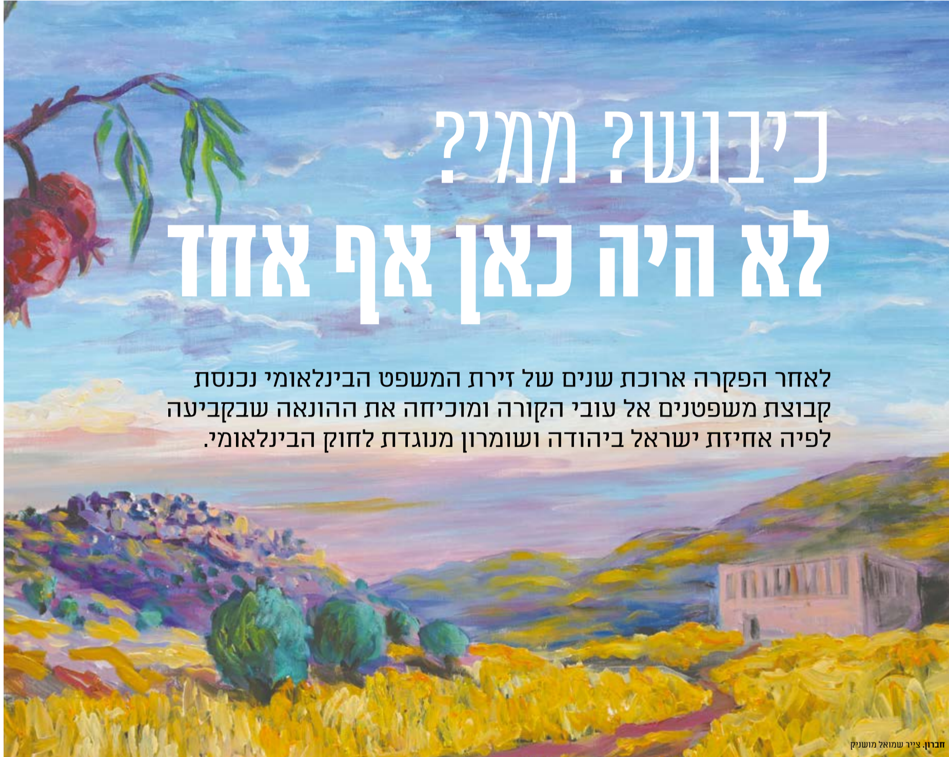
חברון, ציור שמואל מושנק

כשראש מרכז בגין – סאדאת בוחן את היתכנות קיומה של מדינה פלשתינית הוא עושה זאת באיזמל מנתחים קר ומגיע למסקנה ברורה: גם אם היינו רוצים, זה פשוט לא עובד.