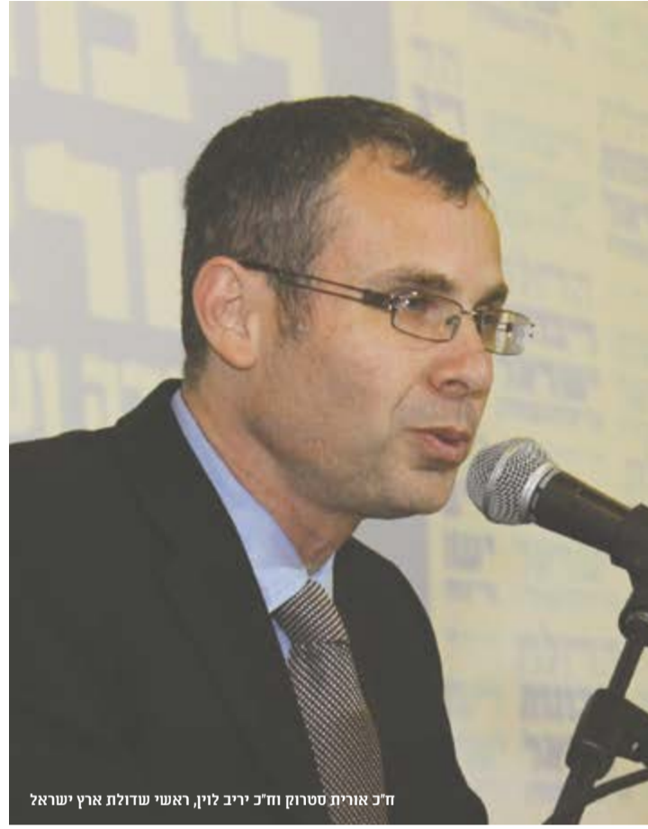
ח"כ אורית סטרוק וח"כ יריב לוין, ראשי שדולת ארץ ישראל

בעוד רבים מדברים, מכריזים ומצהירים הצהרות, על שולחן הכנסת כבר מוכנים עשרה חוקי ריבונות הנוגעים לעשרה אזורים שונים ביהודה ושומרון. מאחורי המהלך עומדים צמד ראשי השדולה למטן ארץ ישראל, חברי הכנסת אורית סטרוק ויריב לוין. האם אנחנו מתקרבים למימוש המהלך?