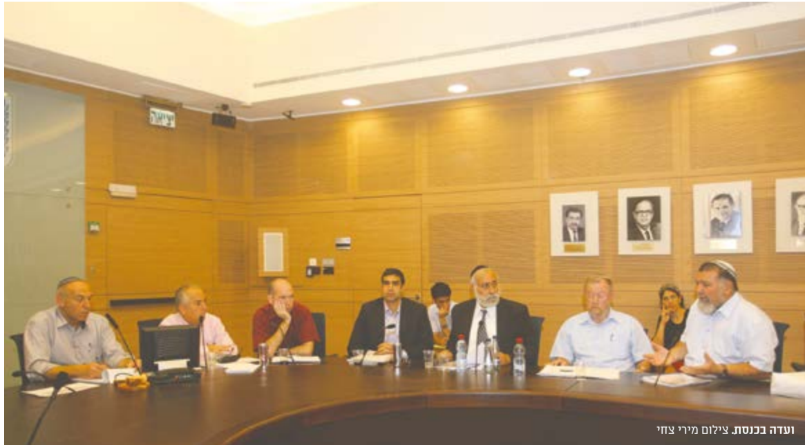
ועדה בכנסת.

מדובר במהלך אחד שמתחיל בהחלת הריבונות ב-48' ונמשך עד החלת הריבונות בימינו. זה אותו הרצינאל שמדבר על קם העם היהודי ובה הייתה כל ההיסטוריה שלו. מעולם לא היה כאן בית לאומי לשום עם אחר